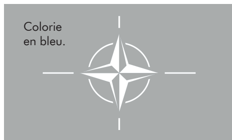
Drapeau de l'OTAN.

10. Cyberdéfense. Les cyberattaques devenant de plus en plus fréquentes, sophistiquées et destructrices, la cyberdéfense est à présent une priorité majeure pour l'OTAN.