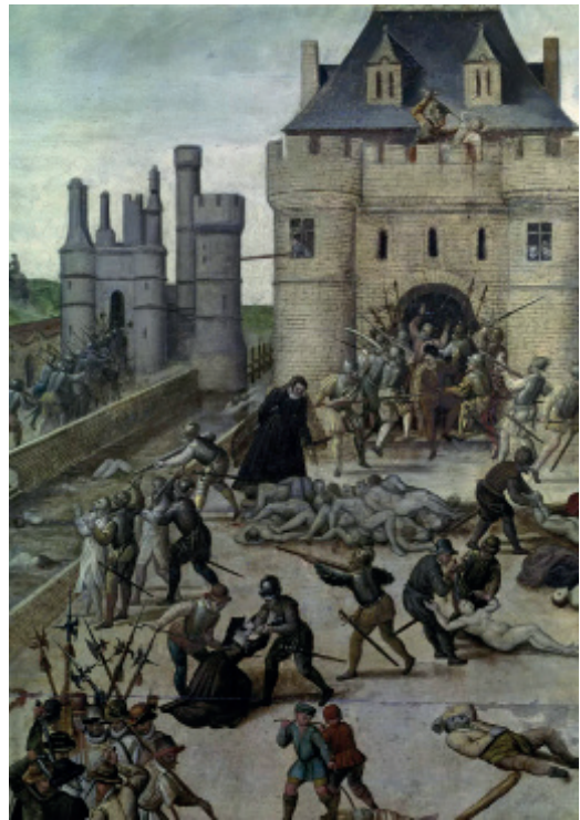
Le massacre de la Saint-Barthélémy, François Dubois.

En France, les guerres de Religion constituent une série de huit conflits qui se sont déroulés entre 1562 et 1598. Elles s'amorcent sous le règne de François II avec la conjuration d'Amboise (1560) et trouvent leur paroxysme avec le massacre de la Saint-Barthélemy (1572). Elles se terminent par la signature de l'édit de Nantes en 1598. En Basse-Navarre, royaume distinct du royaume de France au XVI e siècle, un conflit de même nature eut lieu de 1560 à 1572. À la fin du XVII e siècle et au début du XVIII e siècle, la révocation de l'édit de Nantes (1685) amena le roi de France Louis XIV à lancer une série de campagnes de persécutions religieuses – connues notamment sous le nom de « dragonnades » – contre les populations protestantes à l'intérieur même du royaume de France, celles-ci aboutissant finalement à la guerre des Cévennes menée contre les Camisards. C'est seulement à l'époque du roi soleil que le terme de « guerre de religion » s'établit pour désigner les conflits confessionnels des XVI e et XVII e siècles.