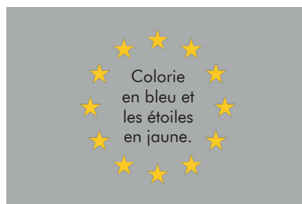
Drapeau de l'Union européenne.