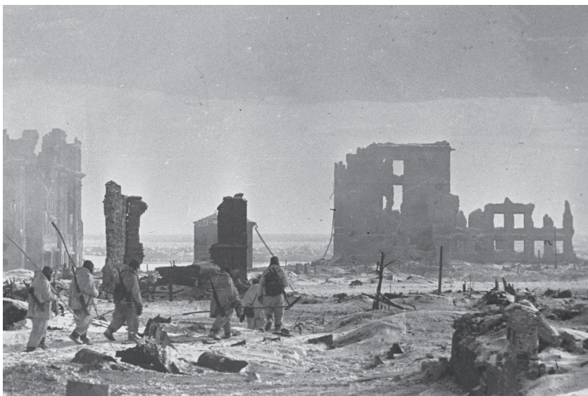
Le centre de Stalingrad après la Libération.