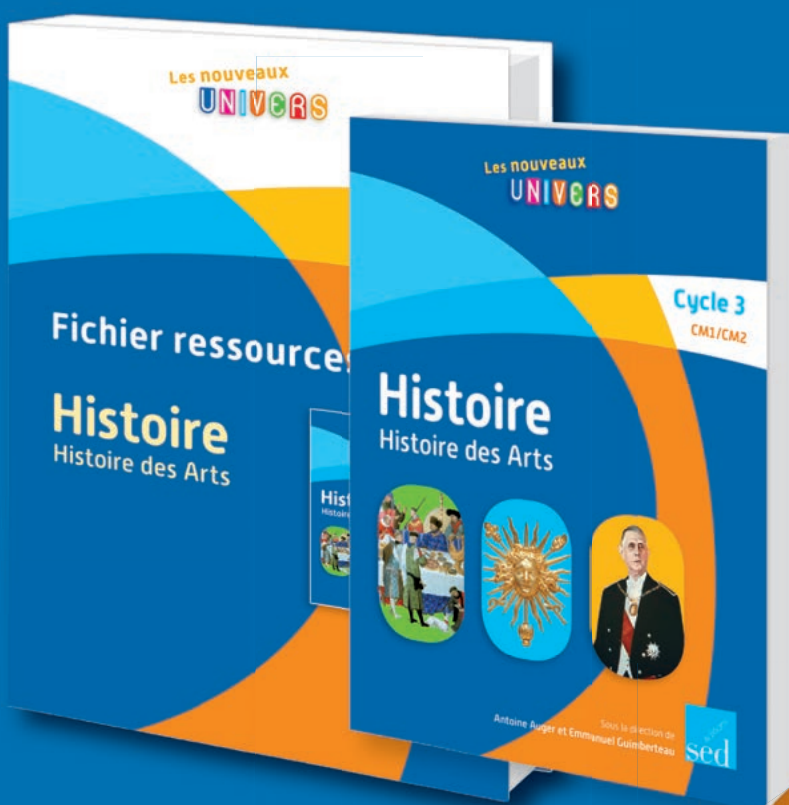
Le livre de l'élève et le fichier ressources